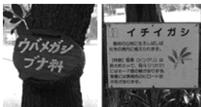
図-1. 樹木の名札と解説板

「林試の森公園 ふれあいコース」の4種類の資料には、「珍しい樹木①日本産」、「珍しい樹木②外国産」、「身近な樹木③」、「虫が集まる樹木・くらしに役立つ樹木④」