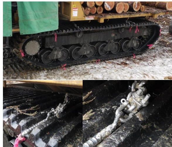
図-4 . 滑り止め

フォワーダ B での集材は片道 40 分程度を要する。午前中に 1 回、午後に 2～3 回の搬出を行っている。1 回の積載量が約 5 m 3 となるため、1 日の搬出量は 15～20m 3 となる。距離と所要時間から平均時速 6 km/h が求まるが、林道の勾配のない直線区間で実測したところ 7.4km/h であった。雪上においても一般的な走行速度に近い速度で走行が可能となっている。この走行を可能にしているのが独自開発のクローラチェーン (滑り止め) である。鉄筋とチェーン、シャックル、ワイヤークリップを使用して作られており、片側のクローラに 10 本の滑り止めが取り付けられている (図-4)。