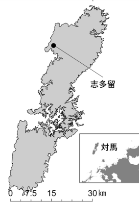
図-1. 木庭作体験開催地の志多留地区の位置 Fig. 1 Location of Shitaru, Tsushima city, Nagasaki, the site of the shifting field (Koba-saku) workshop.

そこで、この志多留地区では、2011年度より住民、日本大学、対馬市、対馬野生生物保護センター等の協働でこれまで途絶えていた木庭作の復活の試みが進められた。2018年度からはツシマヤマネコ木庭作利用実行委員会(以下、木庭作実行委員会)が立ち上げられ、木庭作の新たな価値を模索している(8)。木庭作復活・継続の目的には、木庭作による1伝統的農法の伝承、2獣害対策、3インターン等の体験の受け入れ、4ヤマネコの保全等が挙げ