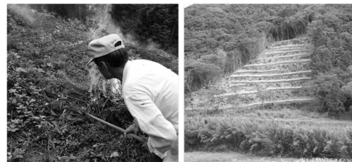
図-2. 志多留の木庭作地 Fig. 2 Shifting field (Koba-saku) land in the Shitaru area.

られる(8)。図-2は木庭作実行委員会が手掛けた木庭作地であり、写真左は火入れをしている場面で、写真右はソバの花が満開の様子である。2018年8月末から9月上旬にかけてインターン等で木庭作体験に24名が参加している。